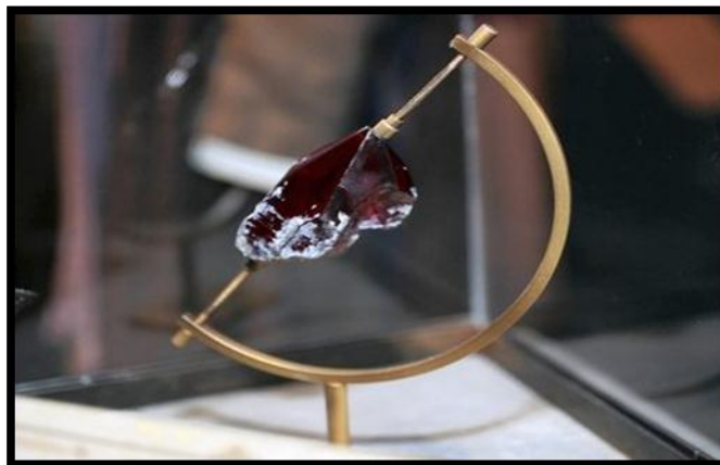
Piedra filosofal en el museo